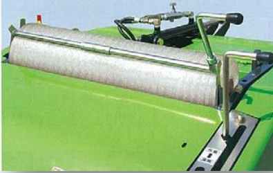
Automatische netbinding 800 mm. rol

12 Hoogwaardige stalen persrollen om een hoge persdichtheid te verkrijgen. Rollen lopen geruisloos, en hebben lage onderhoudskosten.