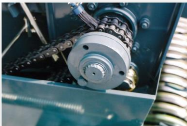
Groothoek aftak as met nokken slipkoppeling, breekbouten op hoofdaandrijving, en pick up met slipkoppeling. Zo wordt schade aan de pers voorkomen.

Bedieningskast voor bediening pers en wikkelaar, met touch screen.