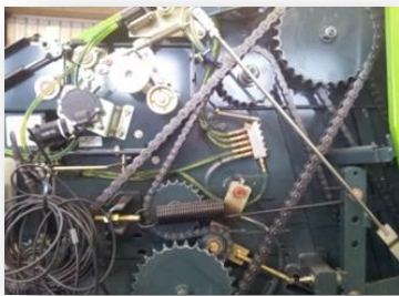
Automatische kettingsmering op de aandrijfkettingen, langere levensduur ketting.

Pers-snij rotor, geeft de mogelijkheid om het gewas met 7 (10 cm) messen te snijden, en de perskamer in te stuwen